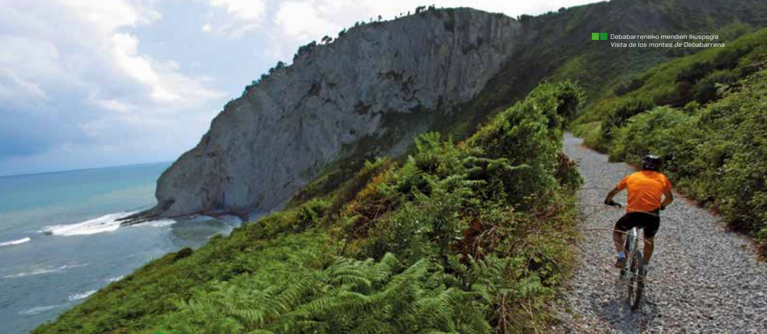
Debabarrena mendian ikuspegia Vista de los montes de Debabarrena